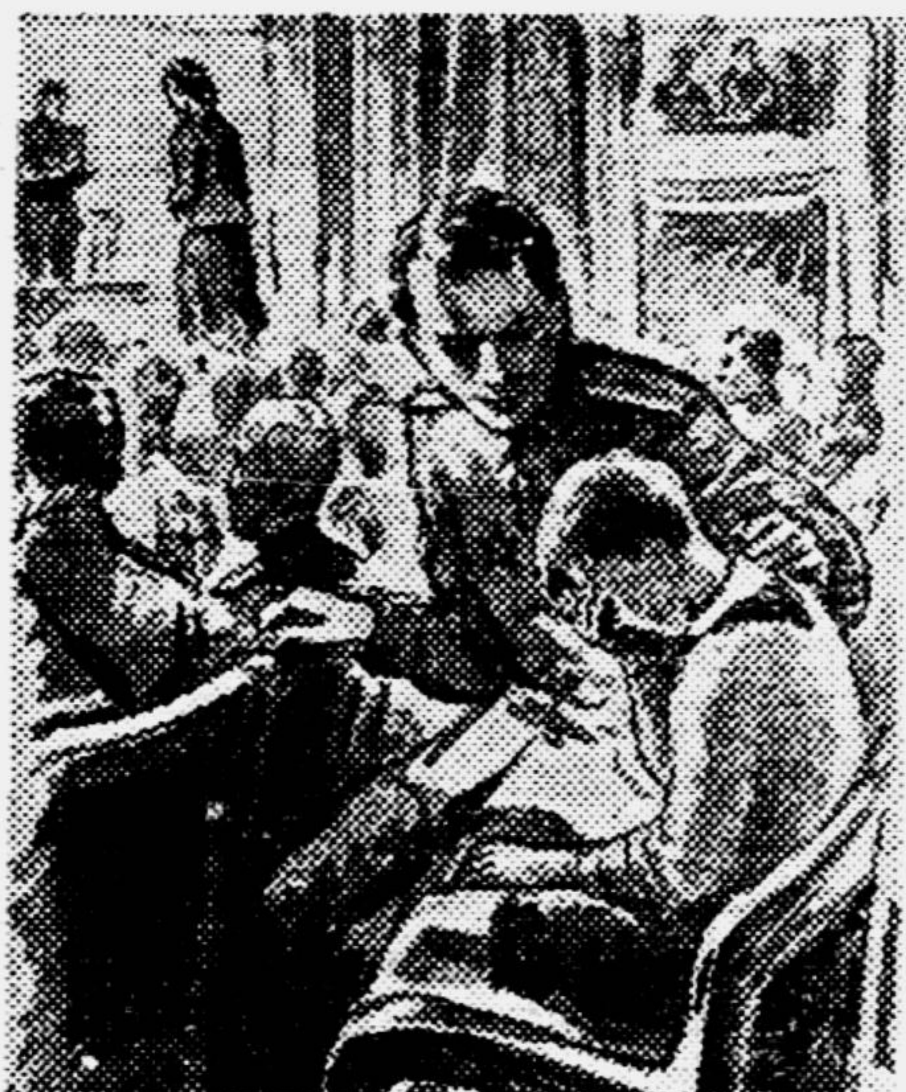
Рис. С. ЛЬВОВА.

Петя молчал. Он боялся, что все в зале узнают, как до сих пор не мог он понять свою мать и причинял ей порой столько огорчений.