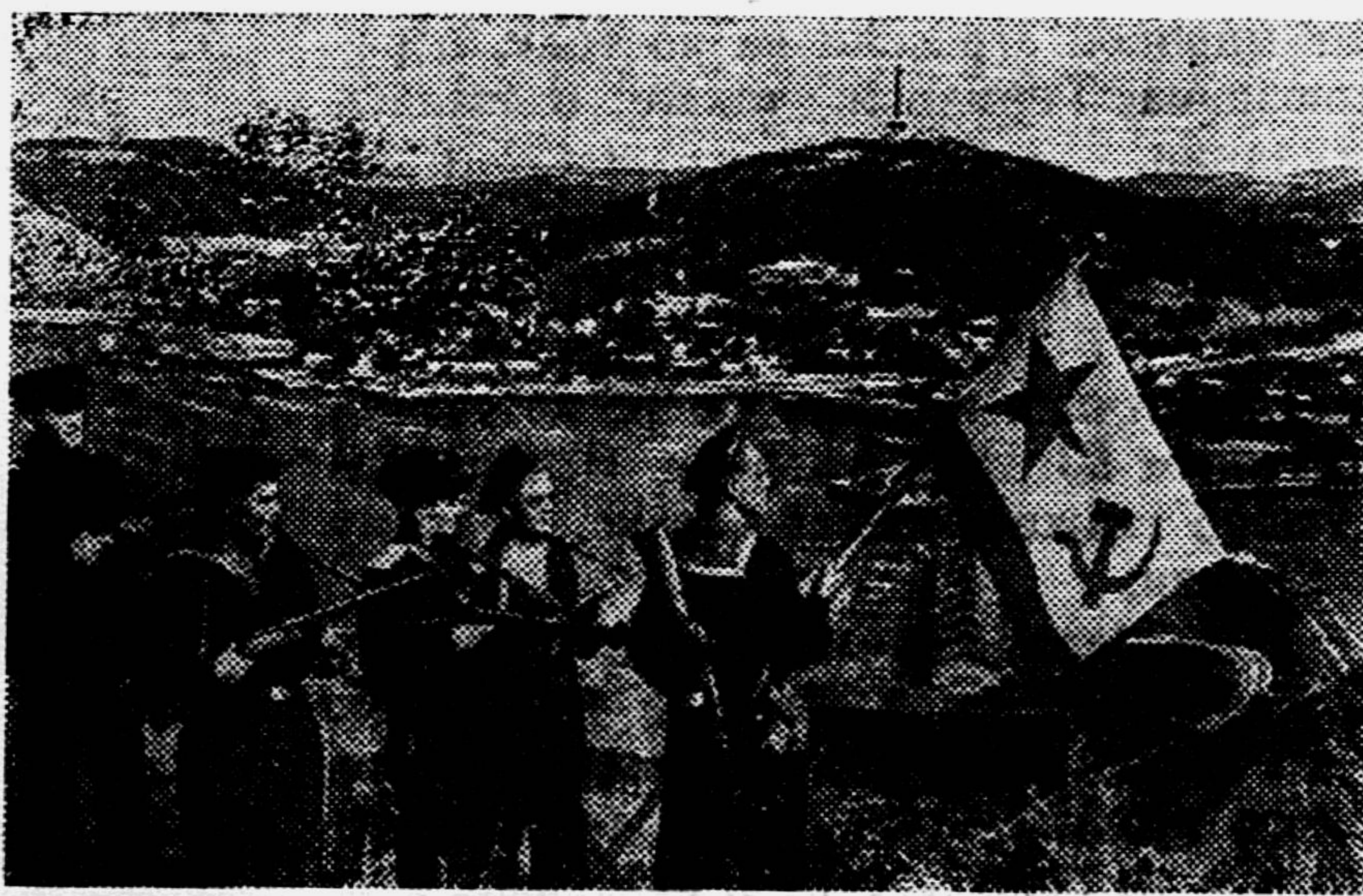
Моряки-десантники Тихоокеанского флота водружают флаг Военно-Морского Флота СССР над бухтой Порт-Артурской.

С тех пор прошло сорок лет. Почти все участники героической обороны умерли. В живых осталось всего несколько десятков человек. Сейчас мечта артуровцев сбылась. Их дети и внуки пришли в Порт-Артур и водрузили на его фортах победное советское знамя.